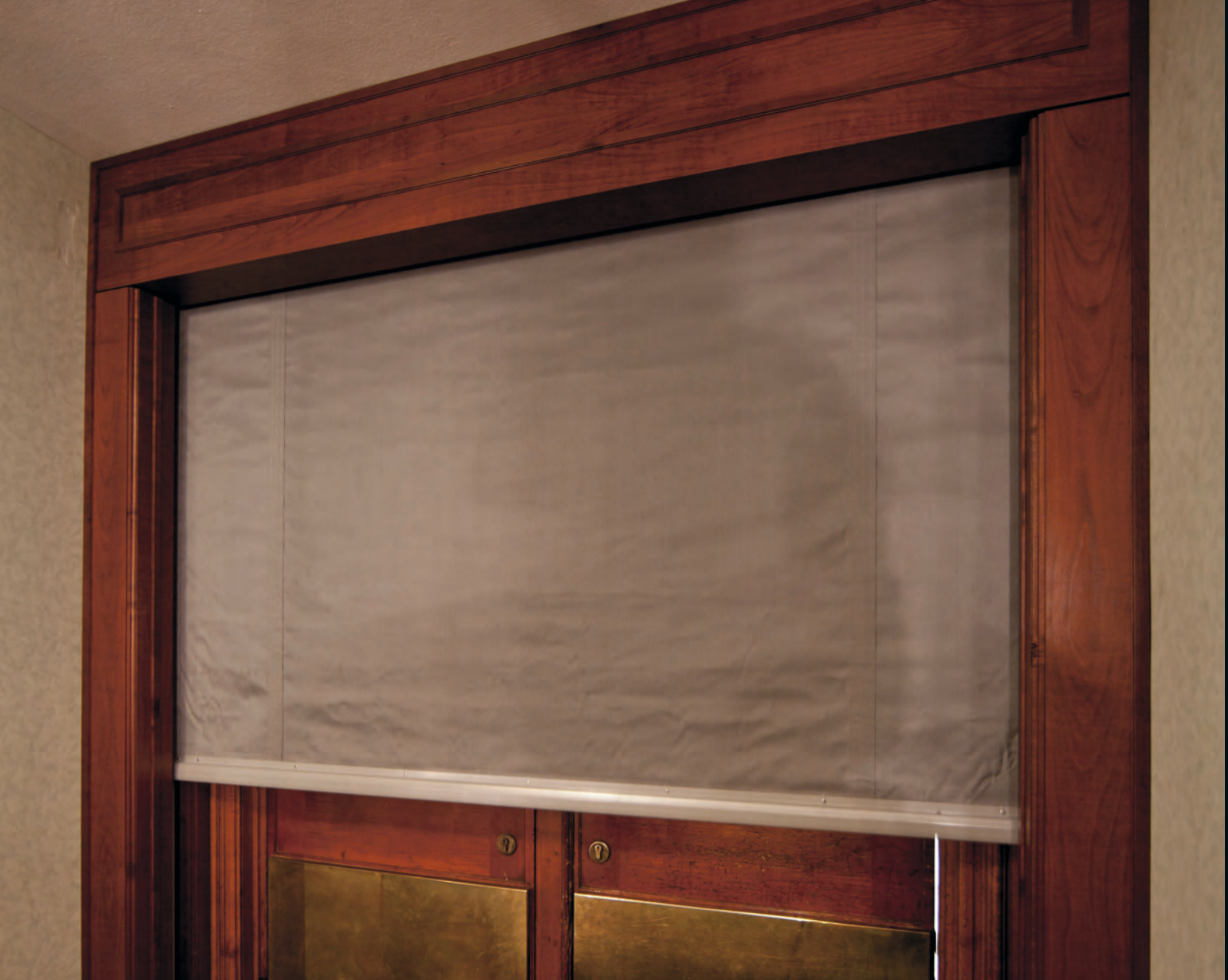
Hotel am Schloßgarten, Stuttgart